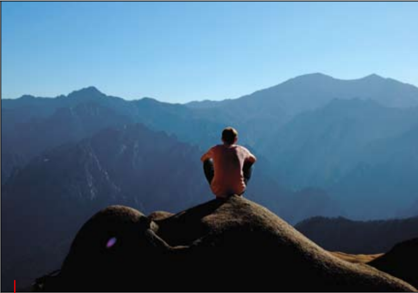
Na vrcholu světa má i Evropan chuť meditovat.

První část přednášky „Korean drinking habits“ probíhala ještě v poklidu.