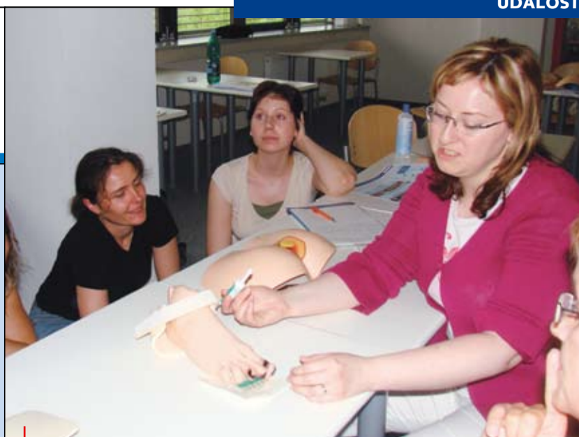
Na kurzech jsou studenti aktivně zapojeni do výuky v rámci skupinových činností s využitím moderních prostředků a metod.

Výuka v kurzu byla zajištěna odborníky z oblasti dermatovenerologie, geriatricie, nemocniční hygieny a epidemiologie a ošetrovatelství. Studující získali také informace z oblasti materiálů vlhkého hojení ran. V rámci všech modulů neprobíhá pouze teoretická frontální výuka, ale studenti v kurzu byli aktivně