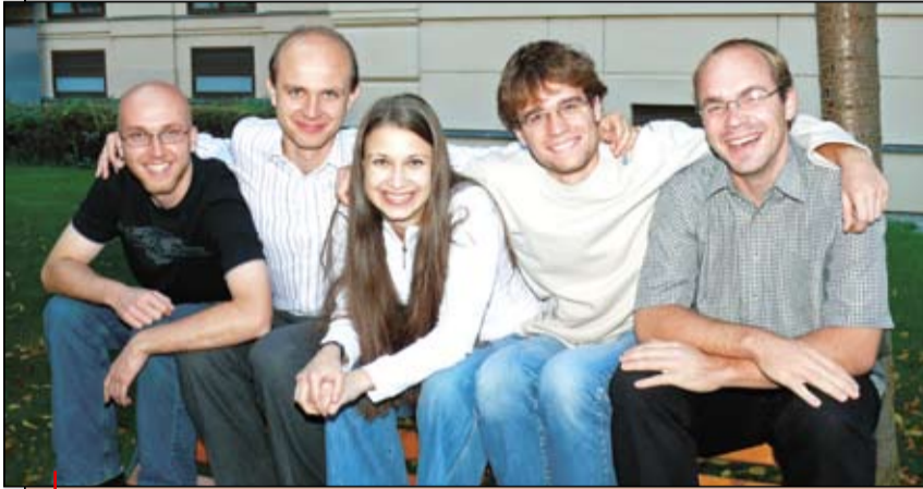
Pět studentů MU je od letošního října k dispozici svým kolegům, kteří se ocitnou v nouzi.

Jako poradce ve složitých situacích týkajících se studia pracuje od letošního října celkem pět studentů MU, kteří jsou dostupní studentům všech ročníků, bez ohledu na obor nebo fakultu, a svou činností vytvářejí prostor pro pomoc těm, kterým se jí nedostalo na správném místě, nebo potřebují nezávislé stanovisko. Jsou připraveni zodpovědět zejména otázky, které se netýkají přímo jednotlivých oborů, ale spíše obecné procedurální studijní otázky (Studijní a zkušební řád MU, poplatky za studium, práva a možnosti studentů).